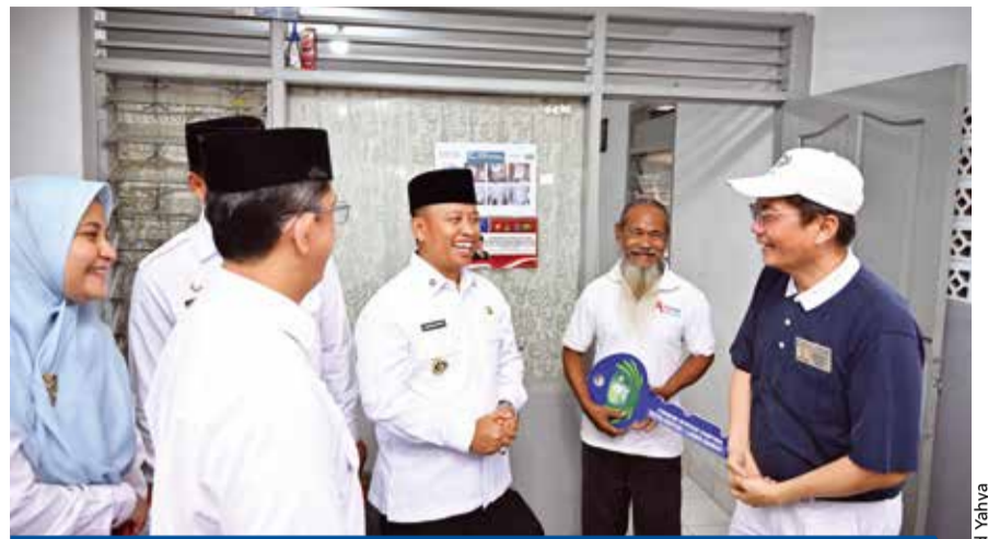
SERAH TERIMA KUNCI RENOVASI RTLH DI DEPOK (4 MARET 2026)