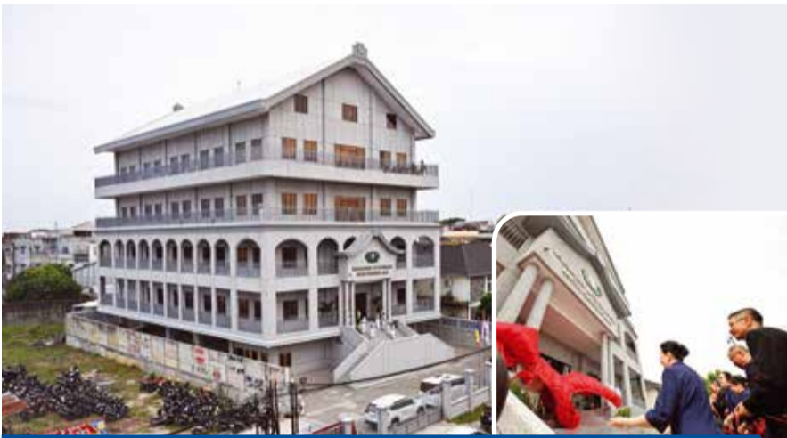
PERESMIAN KANTOR TZU CHI JAMBI (8 MARET 2026)

MENARIK KAIN SELUBUNG. Relawan Tzu Chi meresmikan Kantor Penghubung Tzu Chi Jambi yang terdiri dari lima lantai dengan luas sekitar 680 meter persegi per lantai, total luas bangunan 3.820 meter persegi. Kehadiran kantor ini diharapkan dapat memperkuat kegiatan kemanusiaan para relawan, sekaligus memperluas jangkauan pelayanan bagi masyarakat di Kota Jambi dan sekitarnya.