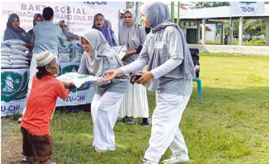
Jelang Idul Fitri, relawan Tzu Chi membagikan 700 sak beras cinta kasih kepada warga Perumahan Cinta Kasih Peunaga Baro dan masyarakat di sekitar Kota Meulaboh, Aceh.