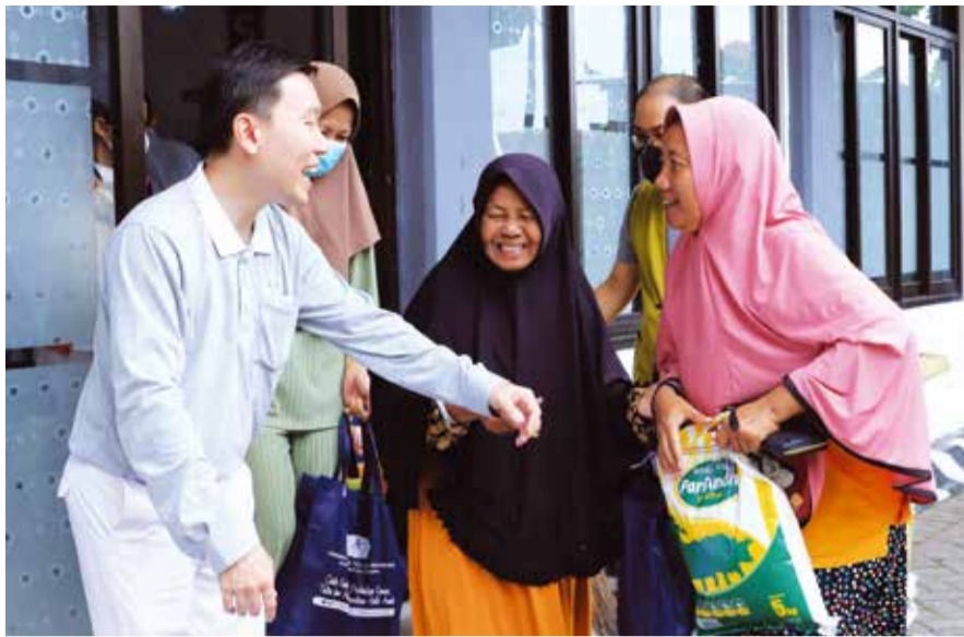
Sambut Ramadan dan Idulfitri, relawan Tzu Chi Surabaya salurkan 1.500 paket bantuan kepada warga di beberapa wilayah di Surabaya, Jawa Timur.