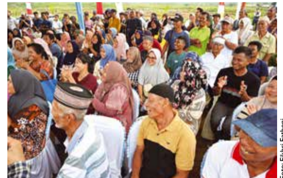
Yayasan Buddha Tzu Chi Indonesia bersama Pemerintah Republik Indonesia menggelar acara serah terima 120 rumah (Hunian Tetap) kepada warga penyintas bencana di Desa Hapesong Baru, Kecamatan Batang Toru, Kabupaten Tapanuli Selatan.