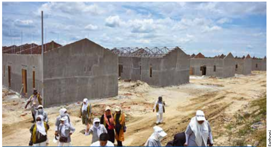
UPDATE PEMBANGUNAN HUNTAP DI SUMATERA (31 MARET 2026)

PEMBANGUNAN HUNTAP DI ACEH TAMIANG. Relawan Tzu Chi meninjau lokasi pembangunan Huntap bagi korban banjir di Aceh Tamiang yang berlokasi di Tanjung Seumantoh, Kecamatan Karang Baru, Kabupaten Aceh Tamiang. Di wilayah ini akan dibangun 500 Huntap yang merupakan bagian dari 2.603 Huntap bagi korban banjir di Aceh, Sumatera Utara, dan Sumatera Barat.