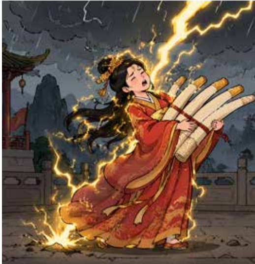
Ilustrasi: Arimami Suryo A.

melihat bunga yang begitu indah diberikan kepada istri pertama, ia sangat marah dan timbul kebencian dalam hatinya. Dia bersumpah dalam hatinya, “Pada kehidupan mendatang, saya akan membalas dendam dengan cara sekejam mungkin. Saya pasti membalas dendam.”